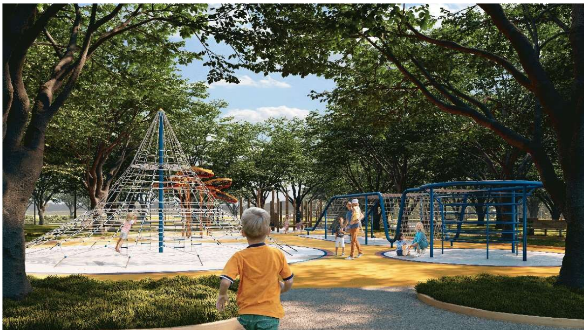
Wizualizacja 2. Widok na ogólnodostępny plac zabaw w Parku nad rzeką Ślężą.