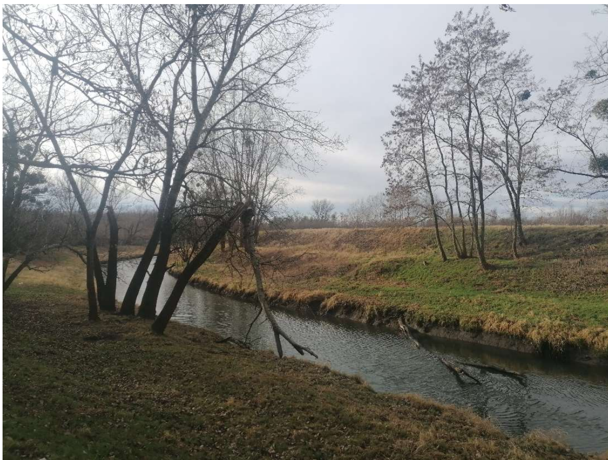
Fot. 3. Aktualny widok na południowo - zachodnią część terenu (archiwum własne).