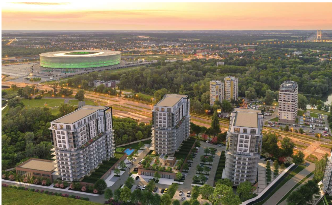
Wizualizacja 1. Widok na północno - zachodnią część terenu (archiwum własne).