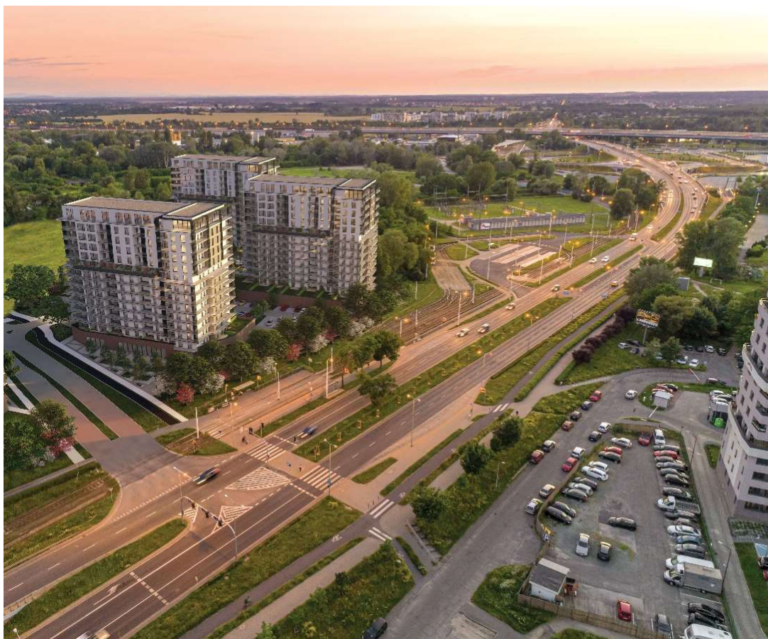
Wizualizacja 2. Widok na południowo - zachodnią część terenu.